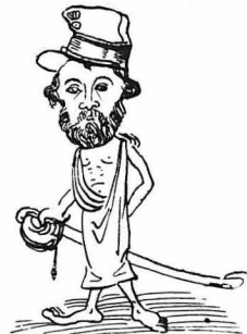
Μεταξὺ τῶν ἡρώων ἦταν κι' ὁ 'Όμηρος.