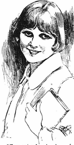
Ἦταν πὸ γλαστῆ καὶ χαροῦμένη...