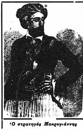
Ὁ στρατηγὸς Μαρτυριάνης