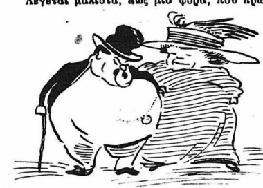
Πώς είμαστε και ζωντανεί νά λέε.

Πλουσίαντες οι Μπακαλιάρου άποφασίσαν νά έγκατασταθούνη στην 'Αθήνα, όπου η κ. Μπακαλιάρου, χωρίς ν' άργήση έπισας σχέσιος με όλες τις μεγάλες οικογένειες. 'Ετσι, όπως και όλη η 'Αθηναϊκή άριστοκρατία, πήγαμαν σ' όλες τις πρώτες τών θά-τρων, είχαν άφωσμένες ημέρες για νά Φάλλου και ήσαν πάντοτε παρόντες σέ όλα τά... «μπαίν-μίζε» κ.τ.λ.