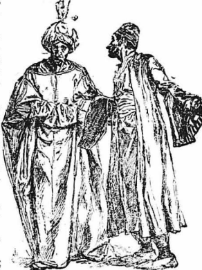
Έφτασε στή Μεγάλη πόρτα τού Παλατιού