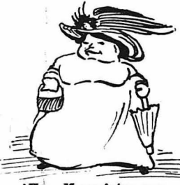
Η κ. Μπακαλιάρμπαση