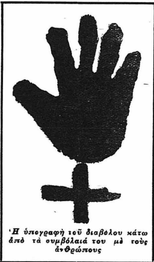
Ἡ ὑπογραφή τοῦ διαβόλου κἀνα ἀπὸ τὰ συμβόλαια του μὲ τοὺς ἄνθρώπους

Ἄς δοῦμε τώρα τὴ βασανισμένη ζωὴ κερνοῦσε καὶ τὴ οἰκτρὸ τέλος ἔβρισσε ἐκεί-