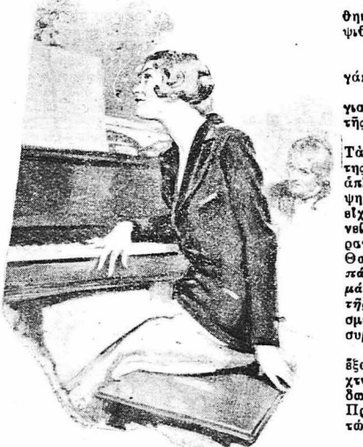
Μερικές στιγμές ξεχνιόταν έντελώς...

Κατέβηκαν κατόπι στο σταθμό και πήγαν το τραίνο στο Παρίσι. Σ' όλο το διάστημα του ταξιδιού ή 'Ιωάννα ήταν βυθισμένη σε σκέψεις, έντελώς ένεση. ('Απολουθεί)