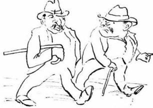
Οἱ δύο παραγωγισμένοι βγήκαν.

— « Ἄστα, βρε ἀδερφέ, τώρα καὶ σουρούπουσε ! Μ'αὐτὰ τὰ « Ἐπειδὴ » καὶ « Διά ταῦτ » χτυπίσαμε ἔδω, χαθίκαμε στὶς ἐπαρχίες, ἐνὼ κάτω εἴχαμε νὰ δειζοῦμε καὶ μεῖς στὴ ζωή !... Ἄντρε καὶ θὰ περιμένῃ ὁ Δήμαρχος ! « Ἐκλεισαν λοιπὸν τὶς δικογραφίες, κλειδῶσαν τὸ γραφεῖο τους καὶ βγήκαν βιαστικοί, οἱ δύο « παραγωγισμένοι !... »