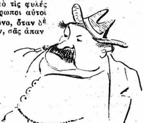
Κι' ἐγὼ Ζαχαροπλάστης.

Λοιπὸν ὑπάρχει καὶ λαὸς, ὁ ὁποῖος ζῆ ἐκτὸς χρόνου. Ὁ λαὸς αὐτός εἶνε οἱ Ὀστιακί, μὰ ἀπὸ τὶς φυλῆς τῆς Βορείου Σιβηρίας. Οἱ ἄνθρωποι αὐτοὶ δὲν ἔχουν νὰ μετροῦν τὸ χρόνο, δταν δὲ τοὺς ρωτήσῃς τί ηλικία ἔχουν, σὰς ἀπαντοῦν τόσων, ἢ τόσων... χρόνων. Οἱ Ὀστιακί ἀνοοῦν ἐπίσης καὶ τὴν ἡχθῶν τῶν γραμμάτων, τοὺς δὲ λογαριθμοὺς τῶν πῆρα ἀπὸ τὸ ἕκατο δὲ μποροῦν νὰ μετῆσουν—τοὺς κρατοῦν στὴν... καλὰμῃ, ὅπου τοὺς σημειώνουν, μὲ μιά εἰδικὴ μοργιά, μὲ διάφορες γραμμίτσες.