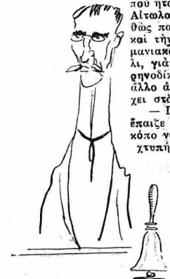
— Ἐγὼ θὰ ἤμουνα Πρόεδρος