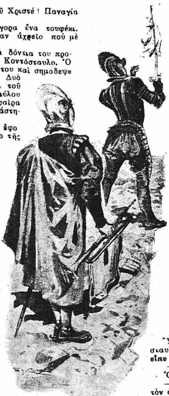
— Σταθῆτε !... Πάσατε πῆρ !...