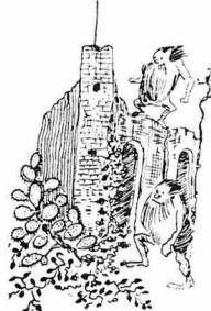
Γεμάτο από ανθρώπους μαλλιαρούς!

Τόν βλέπω ολοζώντανον μπροστά μου, τόν άγιο ήγούμενο τής 'Γεράς Μονής, προκίλην, καθόρθωμένον, γεμάτον, μέ κόκκινα τά γένηα και φουσκωμένα τά μάγουλα!... Μουάω... πώς άίσθανομαι τήν μωροδία του λειβανιού πούβγαλον τά ράσα του και πώς βλέπω τό χέρι του ν' άπλώνεται γιά νά τό φιλήσω.