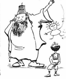
Μή νά πειραξής! Είναι του Χριστού!...

Άνατριχίλλα μ' έπιασε. Όποιος τά άγγίξει θά πεθάνη!... Έναβλε ό άγιος ήγούμενος σπαράξ.