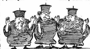
— Μακράν άφ' ήμων ό Πειρασμός και μακράν άφ' ήμων ή πονηρία!