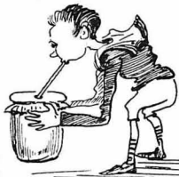
Τό ροφούσαμε μέ ένα μακαρόνι

Ό ήγούμενος Τιμόθεος, γύριζε και ξαναγύριζε τά βάζα, και δέν μπορούσε νά λύση τό μυστήριον. Πώς φαγοθήσαν τά σιρόπια, ένα όλα τ' άποδεσμάτα και τά σημάδια ήσαν άγνήχτα!... — Πρωτακόσμοι και άνεξηγητο!... Πώς έγινε αυτό τό πράγμα; — Ούσι, πετάχτηκα έγώ τότε, δέν ειπες ποιά