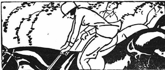
ΑΠ' ΟΛΟ ΤΟΝ ΚΟΣΜΟ