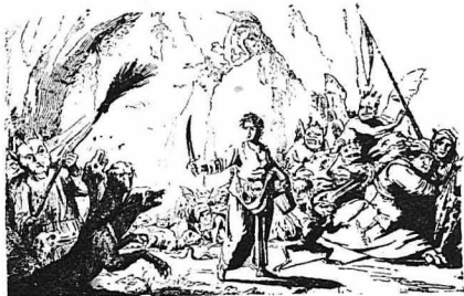
Η άπόκρυψη τελετή των «Σαββάτων»

Άν κατά τύχη έπιανε βροχή τήν ήμέρα της συνάξεως, οι μάγοι δέν έλιζαν παρά νά προσφέρουν μαρικά μαγικά λόγια, κ' έτσι ούτε σταλαγματιά δέν έπιφτε άπάνω τους !..