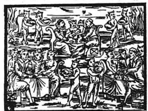
Τό συμπόσιον των μάγων και δαιμόνων

Άμα γινόντανε ή καταγ-γελία, οι δικαστοί φρόντι-