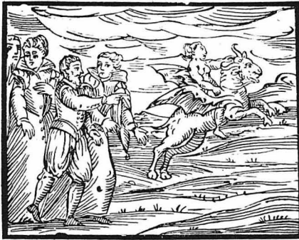
Οι μάγοι, ξεκινάνε για τη νυκτερινή σύναξη των δαιμόνων. Μπροστά πηγαίνει ο διάβολος, που τους οδηγεί.

Τί κάμνει ή άμείθει. Ο μεσαιών και ή φρίκη του. Τι ήσαν τά «Σάββατα». Οι μάγοι και ή δαιμονες. Τι έφραγτάζετο ο λαός γι' αούτους. Τι γράφουν τά περίφημα μεσαιωνικά συναξάρια. Άκαισίως νυκτερινές τελετές. Μακάβρια συμπίσεια. Η διαβολοσύναξις. Τά έργα του άρχισατανά. Πώς άνεκαλύπτοντο ή μάγισσες. Πώς τις έβρασανίζαν. Τό οίκτρο τέλος έν μέσω των φλογών !..