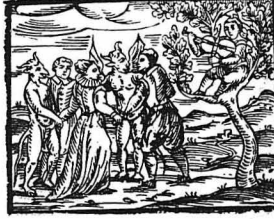
Χορός μάγων, μαγισσών και δαιμόνων

Όταν θά έμπαιναν στήν όμήγηση, οι μάγοι έπρεπε νά πέσουν νά προσκυνήσουν τό Σατανά, τόν άρχηγό της συγκέντρώσεως. Ο άρχοντας του Κακού καθότανε σ' ένα θρόνο, με τό φυσικό παρουσιαστικό του, χωρίς νά εινε μεταμορφωμένος. Έιχε κεφάλι και πόδια τράγου, μιά μακρά ουρά και φτερά νυχτερίδας. Όστος, κέπου—κέπου, παρουσιαζότανε στους πιστούς του και με διαφορετικό παρουσιαστικό, άλλοτε με τη μορφή κυκαριστιού, άλλοτε με σώμα μαύρου γάτου και ούτω καθέξής.