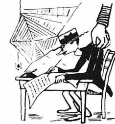
Πολυτεχνίτης κ’ εφημοσίτης!...