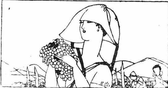
ΑΠΟ ΤΟΥΣ ΚΑΜΠΟΥΣ ΚΑΙ ΤΑ ΒΟΥΝΑ ΜΑΣ