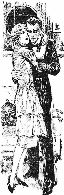
- Άγκάλιασέ με, αγαπή μου!...

Όταν έφθασε έκεί, πονούσε άκόμη τρομερά άπ' τά χτυπήματα σ'όλο τό κορμί της. Άλλά μόλις πέρασε τό κατώφλι έννοιωσε νά