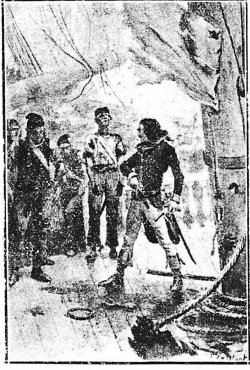
Ο ΛΙΝΟΣ ΕΠΙ ΤΗΣ ΠΡΕΦΕΡΔΑΣ «ΑΤΑΛΑΝΤΗ» (7 Μοῦν Γου).— Ἡ γαλλικὴ φρουρὰ «Ἀταλάντη» περικυκλωθεῖσα ἀπὸ μιστροὺς τοῦ Ἀγγλικοῦ στόλου, ἐνιστάθη κῆ ἠρωϊκῶς, μὰ ἐπειδὴ ἡ πάλη ἦταν ἀνισή, δὲν ἄρχισε νὰ μεταβληθῇ εἰς στόχο τῶν ἀγγλικῶν κανονιῶν. Τότε μερικὸι ναῦτες ἐπρόσθεναν εἰς τὸν κινδύνον τους τὰ λινοῦ νὰ παραδοθῶν στοὺς Ἀγγλοὺς. Μὰ κἀποὶς τραβώντας τὸ πιστόλι του, τοὺς ἐπῆντο : «Ὅσοις θέλει νὰ παραδοθῇ θὰ ἐχῃ νὰ κἀμῃ μ' αὐτό».

Ὁ Ζουκλὲρ ἀδιαφορεῖ γιὰ τὰ τραυμάτα του, δὲν τὰ λογαριάζει καθόλου : «Μὰ