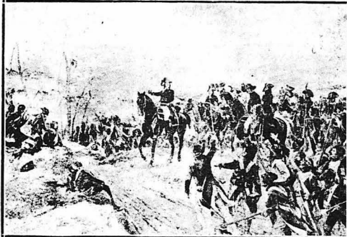
Ο ΗΡΩΙΚΟΣ ΣΤΡΑΤΗΓΟΣ ΛΑΖΑΡΟΣ ΟΣ ΣΤΗ ΜΑΧΗ ΤΟΥ ΦΡΕΣΒΙΛΑΕΡ (1793). Στο Φρεσβίλλερ οι Γάλλοι έπυερμητώντας το νερό στρατηγό τους ώρησαν ενάντιον του πολυαριθμητέρου των έχθρου, τόν όποιον και κατέτρόσαν.