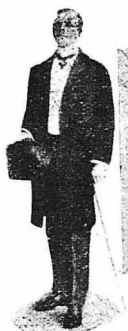
Ο κ. Κάστερ, περιεφημος Άμερικανός ρεπόρτερ.