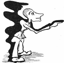
Το πρόσωπο του Καραγκιόζη το έπαιεν ο δικαστής.

Οι άνθρωποι του σπιτιού, στο οποίο θα είδατε ο Καραγκιόζης ήταν ευγενέστατοι. Παρεχώρησαν μια άνωγειο κάμαρη στους στρατιώτες, έσηκασαν τα έπιπλα κ' ετοιμάσαν ένα κρεβάτι, στο οποίο άπάνω θα κοιμόντουσαν πέφτοντας κατά... πλάτος, γιατί κατά μήκος δεν χωρούσαν, πέντε άπ' τους άνδρες της άνωμοτίας.