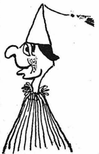
Βρε τόν φασουλή μου παίζετε;

Ο δεκανέας σάν να άμφέβαλε. Έστάθηκε και κύταξε τους ομοψμένους. Τους μέτρησε, τους ξενομέτρησε και τέλος