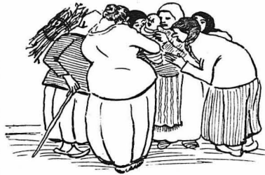
Όλο τό χωριό ειχε διαιερέθη σέ δύο κατηγορίες.