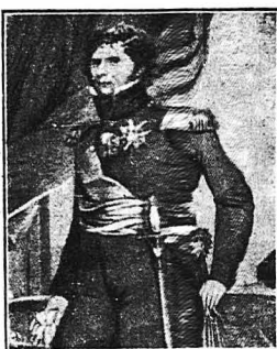
Ο στρατηγός Βερναδόττης ως βασιλεύς Κάρολος XIV τής Σουηδίας.

Ο Ναπολέων σε λίγο, σε ηλικία εικοσιεπτά χρόνων, προεβίστηκε σε στρατηγό και όλοι άρχισαν να προβλέπουν τότε τό λαμπρό του μέλλον. Οίδιος δε δέν είχε κομμιά άμφιβολία γι' αυτό. Να τι έλεγε σχετικώς στη μνηστή του: «Θα σε κάνω να ζήσης τή λαμπρότερη ζωή, μα ζωη που άσφαλώς δέν τήν όνειρευτήκες ποτέ... Έγώ ίσως περάσω από κοντά σου σαν ένα φρεατικό νετέρω, μη, σε βεβαιώνω, ότι η άνάμνησις του περασμάτιός μου θα σου μείνη άσβ στη για πάντα...» Οιδόσιο, η λαμπρή του έξέλιξις φάνηκε για μια στιγμή ν' άνοκόπεται. Τό Διευθυντή μου, που είχε άρχισει να τόν φοβάται, έν έθεσε υπό δυσμενεία και τόν άνεκάλεσε στο Παρίσι, ένδο η κυρία Κλαρύ με τίς κόρες της άκολούθησε τόν Ιωσήφ στην Γένουα όπου