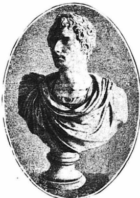
Ο ΒΕΡΝΑΔΟΤΤΗΣ (Προτομή του γλύπτου Γκιράτσι)

Η μικρούλα Ντεζιρέ. Η σύλληψη του αδελφού της. Το διάβημα στον αντιπρόσωπο του λαού. Η γνωριμία με τον Ιωσήφ Βοναπάρτη. Οι άρραβώνες της Ντεζιρέ. Οπου ο Ναπολέων χαλάει το συνοικέσιο και διαρραβώνεται η νύφη. Ερωτικές επιστολές Ναπολέοντος-Ντεζιρέ. Ο Ναπολέων λησμονεί την μνηστή του. Ο στρατηγός που σφάζεται μπρος στη μνηστή του. Οι ύπεσφις και γκι βροί. Οπου εμφανίζεται και ο Βερναδόττης, κ.τ.λ.