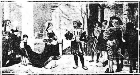
Τό θαύμα τών ρόδων τής Άγίας Ελισάβετ (Πινάξ του Γάλλου ζωγράφου Γκατιέ)