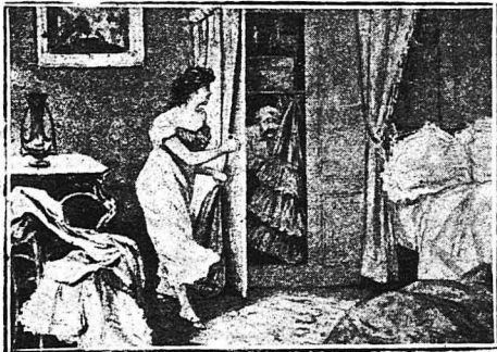
— Έ, λοιπόν; ρώτησε ό 'Ιούλιος τή γυναίκα του...

Έπί τέλους, όσπερ' άπό μιά έρευνα που βράσταζε μιά όρα κ'