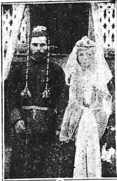
ΟΙ ΝΕΟΝΥΜΦΟΙ ΣΤΗ ΓΕΩΡΓΙΑ. Σέφρανα μ' ένα καλή έθιμο, οι νεόνυμφοι στη Γεωργία φορούν ένα χρυσό στεφάνι, κατά τον γάμο.

Ο σημερινός χαρακτήρ του γάμου. Η άρπαγή των Σαρβίνων. Πώς παντρεύονται οι Αυστραλιανοί. Ο άρχαιος Ρωμαϊκός γάμος. Οι γάμοι των Ταρταρών και οι Νεοελληνικές. Όπου η νύμφη άπαγάγει τόν γαμπρό. Το πούλημα της συζύγου. Ένα έπικερδές έμπόρευμα. Οι γάμοι στη Σιβηρία και στην Κίνα. Περιεργες συνήθειες. Στους λαούς της Ανατολής κτλ.