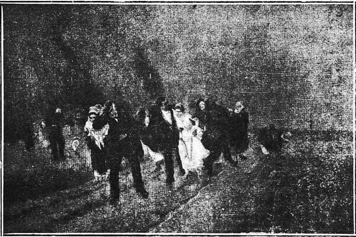
ΜΕΤΑ ΤΟΝ ΓΑΜΟΝ, Η ΘΥΕΛΛΑ. (Πίναξ τού Μπρετόν). Σ' ένα άγροτικό γάμο, μετά την τελετή στην έκκλησία και τó παγετοαόδοτο γλέντι, ή νυμφική πομπή βγίηκε έξω στους άγρούς για ψάξιμο. Μά έξασφα τούς έπιασε ή πόρτα κ' όλοι τρέχουν να βρουν ένα καταφύγιο, θρηνώντας για τις καταστροφές που έπαθαν τά καινούργια τους ρούχα.

Τά ίδια και χειρότερα γίνονται και στην Ιάβα. Και έν πρώτους, έκει της πομπής τού γάμου, προηγείται ένας όμιλος Γιαβανέζων που προχω- ρούν χορεύοντας, χτυ- πώντας τά χέρια τους, και κάνοντας τόν άέρα νάνηχη από τούς έκκο- φαντικούς ήχους τών τυμπάνων και τών κυμ- βάλων. Έπειτα έρχεται τó κλειστό άμάρι μέσα στο όποιο βρίσκονται ό γαμπρός με τή νύφη. Η