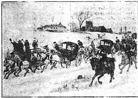
ΜΙΑ ΠΕΡΙΕΡΗ ΓΑΜΗΛΙΟΣ ΠΟΜΠΗ (Άγγλική κωμικοθεατρία). Ό γελοιογί- φος εικονίζεται στην εικόνα αυτή τά έθια των άγγλων εγγενών τών έσχατων. Οι προσκελημένοι για να τιμήσουν τή νύφη άκολουθούν έ- φικλοι με στολή κυνηγών τó άμάρι που την οδηγεί στην έκκλησία μέσ' άπ' τούς χιονιμένους κομπους.

Στην Σκανδινα- βία, σε παλαιό- τερα χρόνια, ή μελ- λόνυμφος κόρη έφερε κρεμασμένη στο πλευ- ρό της τή θήκη ενός ξίφους : Ό νέος που την άγαπούσε έπρεπε να της έξομολογήθη τόν έρωτά του, βά- ζοντας μέσα στη θή- κη τó δικό του ξίφος. Αν ή νέα τó κρατού- σε αυτό έσήμαινε ότι συγκατατίθετο στον έρωτά του. Αυτό τό έθιμο διατηρήθηκε και σε μερικά χωριά της Φιλλανδίας.