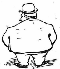
Πού ἦταν ὁ ἀνδρὰς τῆς μεταπαρῆς, τοκογλόφος και μεγαλοκτηματίας.