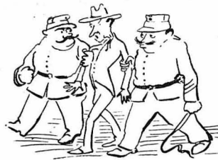
Τὸν ἄρπαξαν οἱ χωροφύλακες και τὸν πῆγαν στὴν Ἀστυνομεία...