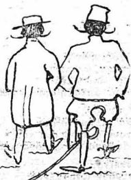
Κι' ὁ Εἰρηνοδικεῖακόσ Δῆρματεῖσ παρασῶρασ και τὸν Ἀστυνόμοσ.