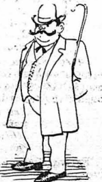
Τὸν ἔπειτ' ὁ κ' ὁ Βουλευτῆσ.