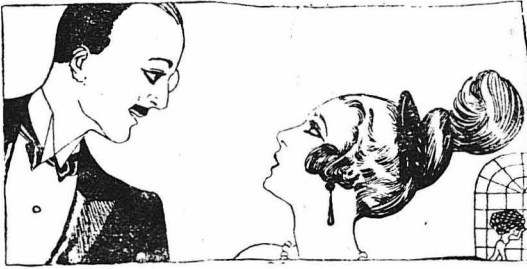
ΟΙ ΗΡΩΕΣ ΤΟΥ 21