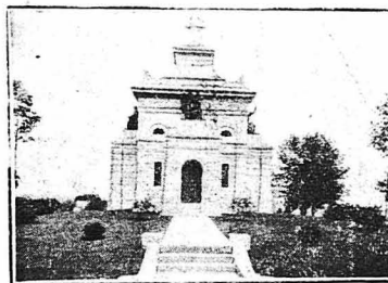
Τό μνημείον του 'Αμερικανού Κροισού Τζων Μάκναι. Έπίτοις δεκαπέντε εκατομμύρια δολάρια.

Αυτός ό 'επικίνδυνος πυρτός του πλουτισμού που είνε τόσο γόνιμος σε καταστραφές, δε θεαλεί τόσο χαμιά άλλη χώρα όσο τίς 'Ηνωμένες Πολιτείες. Ο Τζαίη Γκουλάντ ήταν ένας από τούς πρώτους που έγινε πάμπλουτος χάρις στις χρηματιστηριακές έπιχειρήσεις. Έταν γιός ένός φτωχού γαιοκτήμονος τής πολιτείας τής Νέας 'Υόρκης. Όταν έπινε δώδεκα χρόνων, ό πατέρας του τόν έστειλε, με πνήνια σέντε στην τάση του και με μιά άλλαξιά ρουχα, νά πη νά βρη τύχη. Μέσα σε λίγα χρόνια είχε γίνει μηχανικός, δημιουργός ένός μεγάλου βυρσοβυρείου, κοντά στο όποιο χιούσαν σε λίγο μιά πόλις, τό Γκουλάντοβόροβ κ' ιδιοκτήτης τής σιδηροδρο-