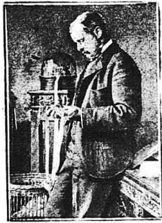
'Ο Γκουλντ, ο τρομερός άμερικανός εκατομμυριοχός, την όψη που λαμβάνει τηλεγραφικώς στο γραφείο του τάς τιμάς τού Χρηματιστηρίου.

'Ενας κάμπλουτος τραπεζίτης, ο Ρούσσελ Σάξ, ο όποιος άρχισε τό στάδιο τού μικρού γκαρδόνι σ' ένα μικρό μπακάλιο της πατρίδος του, συμβουλεύσει όλους όσους θέλουν να γίνουν εκατομμυριοχί να μην καννίζουν, να μη πίνουν οίνουπνευματώδη ποτά και ν' άποφύεουν κάθε κατάχρησι. 'Αμα δέν κάνει κανεις αυτά, έξαικονομει έτσι τάς δυνάμεις του για να πολεμήη και να γίνη πλούσιος. 'Ο Ρούσσελ Σάξ δέν πιστείες αυτό που λέγεται τύχη, γιατί ο ίδιος απέκτησε όλη την περιουσία του με τον ίδιον τού προσώπου του. 'Η εργασία εινε τό πάν κ' οι καλές ευκαιρίες δέν άπολείπουν από τον καλό δουλεφτή.