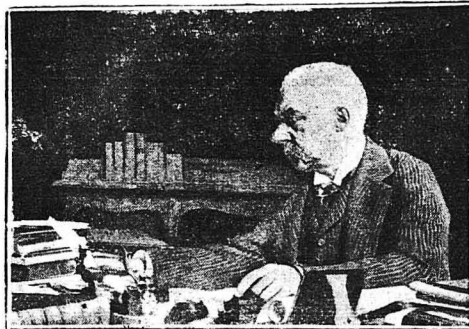
Ο «ΒΑΣΙΛΕΥΣ ΤΟΥ ΑΝΘΡΑΚΟΣ» ΣΤΟ ΓΡΑΦΕΙΟ ΤΟΥ.—Ο 'Αμερικανός δισεκατομμυριούχος Πίερτον Μέγγιν είνε τό έργοστάσι του όποιον εργάζονται 250.000 εργάται.