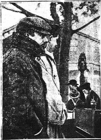
Ο 'Αμερικανός Κροισός Κλάρας Μάκναι ή όποιος κληρονόμος από τόν πατέρα του Ένα δισεκατομμύριο δολάρια

“ Άνθρωποι πιά πλούσιοι από ελόκληρα κράτη. Η παραμυθένια τύχη του Σύλλιαμ Φίλπς. Οι χαμένοι θησαυροί που ξαναβρίσκονται. Περιπέτειες, άτυχίες, θρίαμβοι. Η καταπληκτική τύχη ενός μούτσου. Η επανάσταση των μαύρων του άγιου Δομίγκου. Τα πλοία των σφαγέντων Ευρωπαίων. Πώς ο Ζιράρ έβασε την 'Αμερική. Ο Τζαίη Γκουλάντ, ό τρομερός άνθρωπος. Ένας έπιτικός άγων για τούς σιδηροδρόμους. Πώς τήν έπαθε ο Ροκφέλλερ. Η μάχη του χρυσού. Πώς νά γίνεται έκατομμυριεύχοι. Τί συμβουλευόουν ή Κροίσει κτλ.