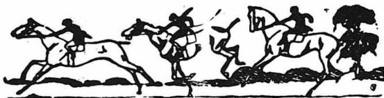
ΑΠΩΣΤΑ ΠΟΙΗΜΑΤΑ ΤΟΥ ΑΛΕΞΑΝΔΡΟΥ ΠΑΠΑΔΙΑΜΑΝΤΗ (*)