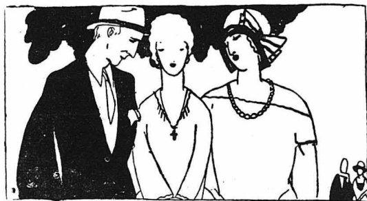
ΤΑ ΠΕΡΙΕΡΓΑ ΤΗΣ ΕΠΙΣΤΗΜΗΣ