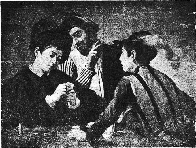
Σ' ΕΝΑ ΚΑΤΑΓΩΓΙΟ ΤΟΥ 16ου ΑΙΩΝΟΣ (Πίναξ του Ιταλού ζωγράφου Καραβάτ). — Σε όλες τις έποχές οι εκδοθείς χαρτοκλέπτες μεταχειρίζοντο παντός είδους τεχνάσματα γιά νά ξεγυμνώσουν τους άρτελιές τους, όποιους παύσαν να πιστεύουν στό παθος της χαρτοπαίικτας. Βλέπεται στην εικόνα μας ένά έπό του; παίκτες ό όποιοι κλοπιμένοι από τό πάθος του παιγνιδιού, δέν άντιλαμβάνονται τό δίδον σπαθί πού με συνθεματικές κινήσεις των δακτύλων αναγνώνι τά χαρτιά του στόν άντικατό του με τόν όποιον είτε συνεννοήμένος άπό πριν.