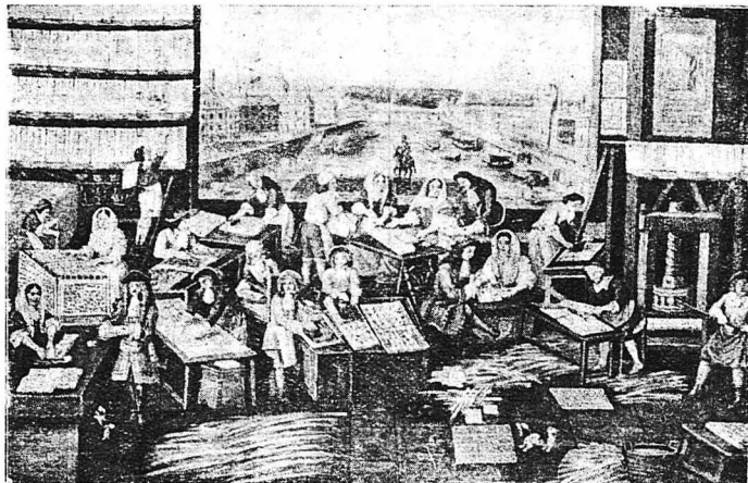
Τὸ ΕΡΓΑΣΤΗΡΙΟ ἕΝΟΣ ΚΑΤΑΣΚΕΥΑΣΤΟΥ ΠΑΙΓΝΙΟΧΑΡΤῶΝ ΣΤΑ ΤΕΛΗ ΤΟΥ ΧΥΠΙ Αἰῶνος. (Εἰκόνη τῆς ἐποχῆς).—Μετὰ τὴν ἐκρηκτικὴν ἐπιπέτειαν ἔργασαται ἕνδρες καὶ γυναῖκες μέσα σ' αὐτὸ τὸ ἐργαστήριον, ἀπὸ τοῦ ὁποῖου φαίνεται ἕνα μεγάλο κομμάτι τοῦ παλιῦ γροφκοῦ Παρισίου! Κατὰ τὴν ἔσο ἡ ἐκείνη τὰ τραγουδιὰ πολυτελεῖα κατασκευαζόμενα ἀπὸ μικροὺς ἀρ-χιτεχνίτες, ἀποτελοῦσαν συχνὰ μιὰ ὀλοκλήρη συλλογὴ μικρῶν πινάκων ζωγραφικῆς, ὀφειλομένων στὸ πινέλλο τῶν πὸν ὀνομαστῶν ζωγράφων.

Ἐπάρχουν χιλιοὶ διὰ τρέποι κλοπῆς τῶν χαρτιῶν, μὰ μ' αὐτοὺς θ' ἀσχοληθῆμε ἄλλοτε.