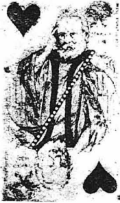
ΤΟ ΡΕΚΟΡ ΤΗΣ ΑΗΜΟΛΙΚΟΤΗΤΟΣ. Τραπεζολόχαρτο εκδοθέν στο Παρίσι το 1881 και παριστάνον τον Βικτωρα Ούγγου.

Μία παρτίδα χαρτιών σ' ένα υπερωκεανέιο. Τεράστια ποσά που χάνονται. Τι έχασε σ' ένα βράδυ, ο νικητής του Βατερλώ. Με τη τραπεζολόχαρτα έπαιξαν οι Ισπανοί στρατιώται στην Αμερική. Η πρόβλεψις των παιγνιοχάρτων. Τι συμβολίζουν οι «φιγούρες». Βασιλείς, βασιλίσσας και ακολουθεί βασιλέων. Οι μεταβολές που υπέστησαν οι «φιγούρες». Μία τράπουλα εκδοθείσα κατόπιν διαταγής του Κάιζερ. Τα χαρτιά και το μέλλον. Η πρωταγωνίστρια της όπερας που μάντευσε το θάνατο του Μπίζε. Άνθρωποι που καταστράφησαν στα χαρτί. Ένα λαχείο που κερδίζεται στο παιγνίδι και κερδίζει κατόπιν ένα εκατομμύριο. Η αυτοκτονία ενός ευγενούς. Οι χαρτοκλέπτες κτλ.