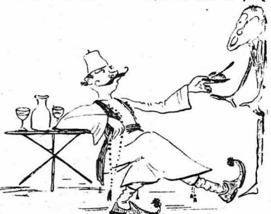
- Ἐλα δῶ παιδί. Ζέστανέ το, σὲ παρακαλῶ, λιγάκι.

Καὶ γιὰ νὰ δεῖξῃ ὅτι εἶνε ἀνθρώπος τοῦ κόσμου «διανοοῦμενος», ποῦ ξέρε ἀπ' αὐτὰ, ἐφώνησε τὸ γκαρσόνι καὶ τοῦ εἶπε μὲ