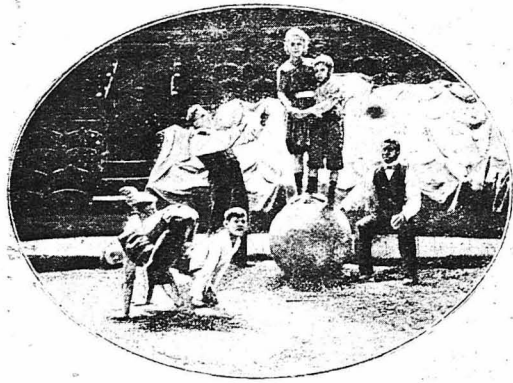
Μή νομίζετε ότι τό επάγγελμα του κλόουν είνε εύκολο όσο φαίνεται. Πρέπει να συντηθή κανείς σ' αυτό από μικρός. Γι' αυτό και ό περι-φημος κλόουν Φουτίνι γυμνάσει, όπως φαίνεται στην εικόνα μας καθε-πρωτό τά παιδιά του.

Πολλές από τις άγγλιές αυ-τές είνε πολύ άπλές, όπως π. χ. « Η μίς Δίτζη Κλίφτον — ειδι-κότης: πηδήματα και τούμπες —είνε έλευθέρη για την περίο-δο των Χριστουγέννων. » Άλ-λες όμως είνε πιά ύφαντικές π. χ.: « Έπιτυχία! Θρίαμβος! Στο Παρίσι, στο Λονδίνο, στο Βερολίνο, στο Μέλμπουρν... Θρίαμβος! Θρίαμβος! Και έπα-κολουθη τό όνομα του διαφημιζόμενου ήθοποιού, έπαναλαμβανό-