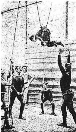
ΠΙΣ ΓΥΜΝΑΖΟΝΤΑΙ ΟΙ ΑΚΡΟΒΑΤΑΙ.—Δεξιόμοι από τη μέση σ' ένα σχοινί περασμένο γύρω από μία τροχαλία, οι νεαροί ακροβάτες μπορούν επί γυμναστών να έλκουν ασφάλεια.

Τό ιπποδρόμιο! ή λέξις αυτή φέρνει άμέσως στο μυαλό μας την εικόνα άλόγων που κάνουν τρελλούς γυρούς υπό τους ήχους μουσικής, άρροβιτών που ηρδούν μέσ' από χάρτινα στεφάνια, και κλόουν που κάνουν άφανταστα πηδήματα και τοίμμε. Ποιός από μιάς, όταν ήταν άκόμη παιδί, δέν ξετρελλάθηκε με τά θέαματα αυτά! Μά έκείνο που βλέπομε στίς περιστάσεις των ιπποδρομιών εινε ή έκωτερική μόνο όγης των πραγμάτων και πολύ λίγο εινε οι άνθρωποι που κωτάρωσαν να μηθούν στά μυστικά των παρισκηνίων τους. Κρί όμως, πόσα περιεργα κ' ένδιαφερόντα πράγματα υπάρχουν σ' αυτά.