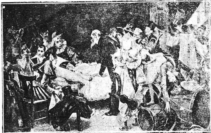
ΜΕΤΑ ΤΟ ΔΥΣΤΥΧΗΜΑ.— (Πινάξ του Νταρμανέν). Παρ' όλη την έμπειρία των καλλιτεχνών και τις προ-φυλάξεις που λαμβάνουν, συχνά στα Ιπποδρόμια συμβαίνουν δυστυχήματα. Στην εικόνα μας φαίνεται μιά νεαρή αφορβή που έπεσε και χτύπησε. Οι συνάδελφοί της έχουν μαζευτεί γύρω της και περι-μένουν την εξέταση του γιατροῦ μέ άγονία. Μία αντίδρασις φαίνεται μεταξύ των παρδαλών ρούχων τους και της φλίψως των προσώπων τους.

Ένωείται ό τι παρ' όλη την εξά-σκηση των άκροβατών και τά μέτρα που λαμβάνονται, συμβά-νουν πολύ συχνά στά Ιπποδρόμια τραγικά δυστυχήματα Γι' αυτό και οι μεγάλοι θίασοι των Ιπποδρο-μίων έχουν άσφαρι-τήτας στο προσωπι-κό τους και ένα ή δύο γιατρούς. Επί-σης οι περισσότεροί ήθοποιοί των Ιππο-δρομίων και προπά-ντων οι «έξαρθρωμέ-νοι» πεθαίνουν νεοί. Άν δέν πεθάνουν γηρασκούν πολύ πρό-ωρα. Έτσι ένας ή-θοποιός Ιπποδρομίου σαράντα έτών δείχνει ότι είνε έξηνητα. Τό ίδιο, και ακόμη πε-ρισσότερο συμβαίνει με τις γυναίκες. Ή καταλληλοτέρα ήλι-κία για άρρασία στα Ιπποδρόμια είνε ή μεταξύ 15 - 20 έτών.