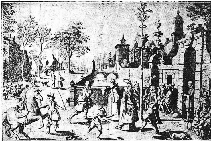
‘Ο χορός γύρω από τό δέντρο του Μαγιού.

διαδομένο σ τ ή ν γαλλική αυτή έπαρξια... ‘Οποδ ήποτε με την έλευση της άνοιξης, ή νοικοκυράδες της Βουγοουνδίας εύρισκαν την ήσυχία τους από τό έτερόν τους ήμισυ... ‘Η άπαγόρευσις μάλιστα αυτή, έλεγε έπίσημοποιήθη και με Διατάγματα τουΚρότους. Οι σύζυγοι, ώστόσο δέν έμεναν πολύ εϋχαριστημένοι, καθώς φαίνεται, από τη συνήθεια αυτή γιατί στο Λυξέιγ, καθώς άναφέρει τουλάχιστον ή ιστορία... επαναστάτησαν έναντι τον του διατάγματος και τό παρέβησαν. Οι γυναίκες τους όμως τότε έσπευσαν νά τους καταγγείλουν ένώπιον της δικαιοσύνης του αϋθέντου των κόμπος ντε Λά Πα-