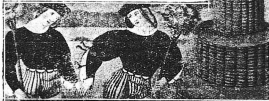
Νέοι βασιλεῖς τῆς λαϊκῆς ἀνάμνησης πῆγαινον γιὰ νὰ στολισοῦν τὸ δέντρο τοῦ Μαΐου.