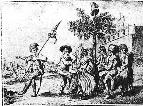
‘Ομοίος άνθρωπων του λαού κατά τη Γαλλική ‘Επανάστασι που χρεΐται γύρω από ένα δέντρο, τό δέντρο της ‘Ελευθερίας, όπως τό έλεγον.

Τόν περιποιόντουσαν όπως του άιτε : Τού πετοίσαν όνάδες όλόκληρες από πίτουρα στα μούτρα και τον υποχρέωσαν νά πηδήση πάνω από τεραστίους κλάδους δέντρων, σωριασμένους στονδρόμο. Συχνά ή εϋθυμης αυτές συντροφίες τά έκαναν κυριολεκτικώς θάλασσα και προκαλούσαν και ζημιές στην πόλη. Μιά φορά, οι ιερείς για νά χτυήσουν δυνατότερα τις καμπάνες της Μητροπόλεως, κρημάστηκαν