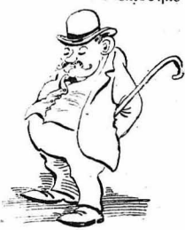
Οσάκις ήρχετο ο κ. Έπιθεωρητής.

Ο Ύπουργός ήταν από τό χωριό μας, ο κύριος Σουρτούκης, ο γιατρός. Τόν είχε βγάλει βουλευτή ο «εγγενής λαός», και έπειδή δυό άλλοι έμάχοντο διά την έδρα της Παιδείας, ο κ. Πρωθυπουργός, διά να μή προτιμήση και δυσαρεστήση τον ένα ή τον άλλον, έκαμιν τον γιατρόν τον Σουρτούκη Ύπουργό, «γιά να έξητυλίση τη θέσα», καθώς τον λέγαν οι άντίθετοί του.