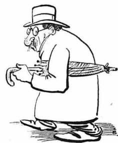
Ο δάσκαλος περιμένε τον κ. Ύπουργό.