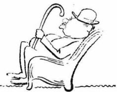
Έκάθησε στην πολυθρόνα σοβαρός.