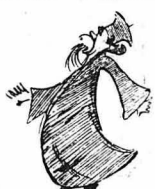
'Ο πάτεσ Λαυρέντιος