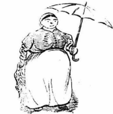
Ή κυρά Μαρίνα ή Τσατσούρα.