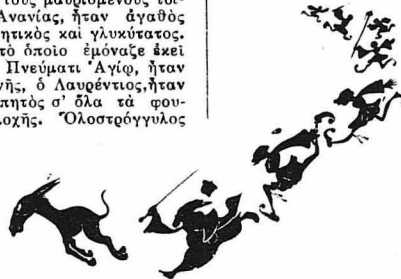
Δίποδα και τετραπόδα ετέθησαν εις καταδίωξιν