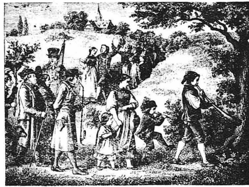
'Η εορτή της Πρωτομαγιάς