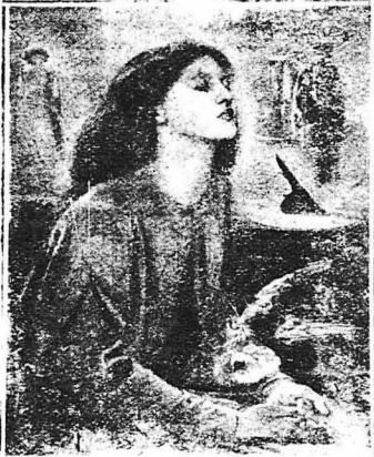
ΤΟ ΟΝΕΙΡΟ ΤΗΣ ΒΕΑΤΡΙΚΗΣ (Είκον του μεγάλου Άγγλου ζωγράφου Νταντε Γκιμπιέρ Ροσσέτι). Βυθισμένη σ' ένα έκστατικό όνειρο η Βεατρίκη είδε το ήμισυ φερόλινο να σπαταλά και να της δείχνει την άρα κατά την οποία έφρακτο να πεθάνει. Σύντομος είδε ότι ένα περιστέρι της άρπασε στα χέρια μι' άσπρη ταλαφύρα, σύμβολο της άγνωστίας και του θανάτου.

γεί με περιστοχική και με θέληση. Η μόνη ζωή του κοιμισμένου—άν μπορεί να λεχθή αυτό—είχε τα όνειρα. Κανένα ταξίδι δεν μ'αξ διφυλάσσει τόσες εκπληξίες όσες ένα ταξίδι στη χώρα των ονείρων. Τι είναι όμως άκριβος τα όνειρα; Είναι τάχα η εκδήλωση μι'ας δύναμης ζήτης προς έμιά, υπερφυσική και υπεράνθρωπη; Κατά την άρχαιότητα, αυτή την άποψη παραδεχόντοσαν. Θεωρούσαν δηλαδή τα όνειρα ως ένα μέσον χρησιμοποιούμενον από τους θεούς για ν' άποκαλύψουν το μέλλον στους ανθρώπους και το όποιο χρ'οσιμειν ακόμα για να φέρη σ' έπαφή τους ζωντανούς με τους πεθαμένους. Από αυτή την άποψη δημιουργήθηκαν τόσα περίφημα όνειρα, τα όποια μ'αξ διέσωσαν οι άρχαιοι συγγραφείς. Ίδου ένα το όποιο άφηγείται ο Πλούταρχος. Ο Σιμωνίδης κάποτε βρήκε στο δρόμο του το πτώμα ενός ανθρώπου τον όποιο δεν έγγνώριζε και το έθαψε. Έπειδή δε έτοιμαόσαν τις ημέρες εκείνες να ταξιδεύη είδε στον ύπνο του τον άνθρωπο, τον όποιο είχε ενταφιάσει και ό όποιος του είχε να μη μ'η στο καρδί με το όποιο πρόκειται να ταξιδεύη, γιατί θά ναυαγήσει. Αυτή ή καθ' ύπνον προειδοποίηση τον έκανε ν' αλλάξη άπόφαση και έτσι έσώθηκε, γιατί σε λίγες μέρες έμαθε το ναυάγιο του πλοίου.