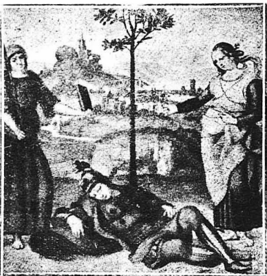
ΤΟ ΟΝΕΙΡΟ ΤΟΥ ΠΙΠΟΤΟΥ (Εἰκὼν τοῦ Ραφαῆλ) Οἱ διάφοροι πόθοι μας κα' οἱ ἐλπίδες μας προκαλοῦν καὶ ἀνάλογα ὄνειρα. Ὁ ἱερωτὴς αὐτὸς εἶφαρε πὸν ὄνειροῦντ ἱεροῦ καὶ ποιήμον, πῆλπει γιὰ τὸν παρουσιάζοντῆ στὸν ἕπνο του διὸ ἀλληγορικῶς πρόσωπα ἡ Ἄδρα καὶ ἡ Ἄνδρεια.