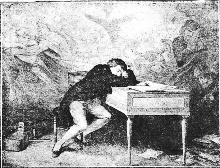
ΤΟ ΟΝΕΙΡΟ ΤΟΥ ΜΠΕΤΟΒΕΝ (Εἰκὼν τοῦ Λομίνε) Ὁ ἐγκέφαλος ἀγγυλιὰ κατὰ τὴ διάρεια τοῦ ὕπνου μας καί, χωρὶς ἔμεῖς νὰ τὸ ἀντιληφθῶμοσθε, δὲν πῆλπει νὰ ἰργάται. Ὅπως βλέπετε στὴν εἰκόνα μας, ὁ μέγας γερμανὸς συνθέτης, ἀποκοιμημένος ἀπάνω στὸ γραφεῖο του, βλέπει στὸνεῖρό του τὸν αὐτὸ τοῦ διαλύοντα τὴν ἐκτέλεσθ μιᾶς συμφωνίας. Μῶσθ στὸνεῖρο οἱ ἰδέες πὸν ζητᾶ νὰ ἐκφρασθ διὰ τῆς μουσικῆς τὸν ἐνασκόνοται καὶ παρελαῖνον μπροστά του μὲ μορφή ἀλληγορικῶν προσώπων.