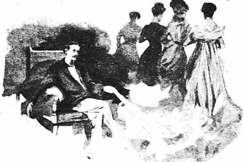
Τὸ ὄνειρο διαλύεται...

Μόλις ὁ Ἀπριλιτικός ἥλιος θ' ἀρχίζε νὰ θερμαίνῃ τὴν καρδιά τοῦ ἀνθρώπου, θὰ ἔβγαζα τὸ φράκο καὶ τὸ μόνιαν καὶ θὰ φοροῦσα ἓνα ἀπλὸ κοστούμι, κίτρινα σακαρίνα καὶ ψαθάκι. Καὶ θάφερα βόλτες στὰ βουλεβάρτα, τὸ βράδυ, ζητώντας νὰ βρῶ καμμά μικρὴ καὶ τσαχπίνια ῥοδιτροῦλο, εὐκίνητη καὶ λεπτοκαμωμένη, μὲ μυτιότα ἀνασηκωμένη. Θὰ τὴν ἔπερα μαζί μου στὸ μικρὸ σπίτι μου πού θὰ νοίκιαζα ἔξω ἀπ' τὸ Παρίσι, σὲ κανένα ἡρεμὸ καὶ γραφικὸ προάστειο. Ἢ ἀνοιξιάτικη φίλη μου θὰ μιλοῦσε ἀλανάριμα καὶ θὰ τρελλανότανε γιὰ ῥομαντὰ καὶ γιὰ κυριακάτικες ἐκδρομῆς. Θὰ ἔβλαψε διαβάζοντας λαϊκὰ ῥομαντικὰ μυθιστορήματα, θ' ἀντέγραφε ἔρωτικὰ δίστακα ἀπὸ ἀπρηχαιωμένες ἀνθολογίες καὶ θὰ πείραζε τοὺς διαβάτες στὸ δρόμο. Θὰ κίναμε μαζί μακρινούς καὶ ἐρημικοὺς περιλάτους στὸ Σηκουάνα καὶ θὰ ἔβλαψε νὰ μὴν τελειώσω ποτὲ τὸ γλυκὸ ὄνειρο τῆς ἀνοίξεως. Ἢ τσαχπίνια φίλη μου θὰ φοβότανε τίς ἀράχνες καὶ τὰ ποτικακίνα, θὰ χόρευε ὅταν τῆς κατέβαινε μὲς στὴ μέση τοῦ δρόμου καὶ κάθε βράδυ, πρὶν κοιμηθῆ, θὰ ἔκανε μὲ πραγματικὴ εὐλάβεια τὴν προσευχὴ τῆς στήν Παναγία... Τὴ μὴ μέρα θὰ ἔδωνα μαζί τῆς ἔκατὸ πενήντα φράγκα καὶ τὴν ἄλλη θὰ ἔλεγα ψέματα πῶς δὲν ἔχοιμε λεπτὰ, γιὰ νὰ μείνωμε νησιτικοὶ—χορτάτοι μονάχα ἀπὸ θεαμὰ φιλιὰ. Ἢ ἂ