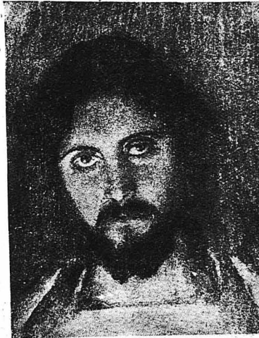
Ὁ Χριστός (Τοῦ Ντονιάν Μπουβερῖ)

Τὸ Θεῖο Μνημεῖο ἔχει μῆκος 2 μέτρα καὶ πλάτος 1,85. Καὶ πρὸς τὰ δεξιὰ ἔχουμε τὸν Τάφο τοῦ Κυρίου, σκαλισμένο ἐπίθω καὶ μπρὸς μὲ δυο λευκὰ μάρμαρα. Ἐπάνω ἀπὸ τὸν Τάφο, στὸ βορινὸ τοῖχο βρισκεται κολλημένο μεγάλῳ μῆρομο μὲ σκαλισμένο τὸ σῶμα τοῦ Χριστοῦ, ἀναστεινόμενο ἀπὸ τὸν Τάφο. Στὶς ἄλλες πλευρῆς τοῦ Μνημείου ἰσχύουν ἄγγελοι κρατοῦντες τὸ Στέμμα τοῦ Βασιλέως τῶν Οὐρανῶν, ἑστὰ