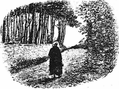
Πήγαινε να βρη το γιό της...

Το πρωί, με τί πρώτα επιβίσηματα τόν σπίνων, ή Καραμπάτσινα όρθια πάλι. Νίφτηκε κει κοντά σε μιá νεροσυρμή, και πήγε στη στράτα, με τά παπούτσια πάντα στον χροί. Θά τά φορώδε μονάχα σάν θά φτανε κοντά στη Φήβα, και μάλιστα την ώρα που θά περνούσαν τά Πυροβολικά, νά μη ντορπισήη το Θανασό της. Και περπατώντας άλύγιση, κι' όσο άνερανε ο ήλιος, τόπο ο δρόμος γινόντανε πιο δύσκολος, γιατί δέντρα δέν ήτανε τώρα στα πλάγια να τήνε δροσίζων... Προσφωρσε ή Καραμπάτσινα με τον Ισκιό της στο πλάγι, που την άκούλουθόσε μακροσφωρο; χάμου. Κόπου—κάπου συναπαντούσε καιένα διαβήτη άπ'