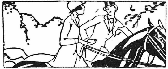
ΑΠΟ ΤΟΝ ΞΕΝΟ ΤΥΠΟ

Μὰ τὸ παιχνίδι αὐτὸ, ἐκείνη τὴν χρονία τοῦ πολέμου, μὰς εἶχε κάνει κάτω ἀπὸ τὰ Λαοβανέλλια νὰ νοιώσωμ καὶ ἡμεῖς κάποιαν Ἀνάστασι τοῦ Χριστοῦ... Κ. Φαλατζίτς