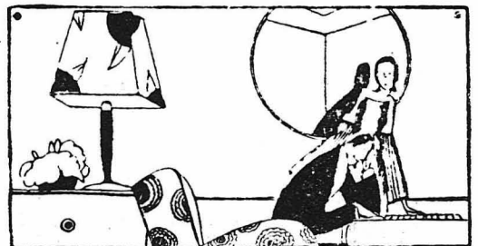
ΑΠ' ΟΣΑ ΔΙΑΒΑΖΩ

'Ο άββας Ζεντουέν στάθηκε ό τελευταίος φίλος της Νινόν. 'Ήτανε καιρός πειά ! 'Υστερ' από λίγα χρόνια, ή Νινόν πέθανε σε ήλικία 84 έτών, πάντα ώραία, πάντα επιθυμητή !