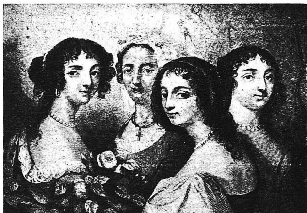
‘Η Νινόν ντέ Λανκλό 40 έτών 80 έτών 20 έτών 60 έτών

Σά; παραθέτουμε; ένα; μέρος; από; μια; τέτοια; έπιστολή; :; ‘Απ’; τόν; καιρό; που; κλήνατε; στον; κόσμο,; καθώς; μου; γράφετε,;—λέει; ή; Νινόν; στο; γράμμα; τής; προς; τόν; νεαρό; ντέ; Σεβινιέ;—δέν; βρήκατε; σ’; αυτόν; τίποτα; άπ’; ; δτι; ειχατε; φαντασθεί; πώς; θά;