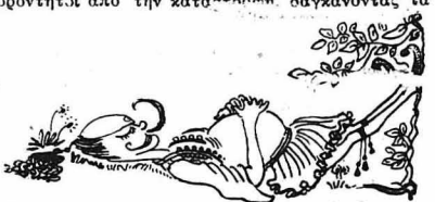
Σαπλομένοι σάν βίλας, με τό στομάχι γεμάτο μαγειρίτσα.

Οι δυστυχεις εφζώνοι στεκόντουσαν έκει τριγύρω, σάν λιθαρένια άγάματα, έμβρόντητα από την καταστροφική διαγώνοντας τά λουριά του όπλιου από πεινα, φυσώνοντας τά ρουθούνια τους, γουρλώνοντας τά μάτια με γαργαλισμούσ και τόν καιρό με σπαραγμούσ εις τό στομάχι. Εύτυχός ύπήρχε άρεκέτό ψωμί, τυρι, γιαούρτι, κρεμμυδάκια, για την δρεξι και μαρουλοσάλατα.