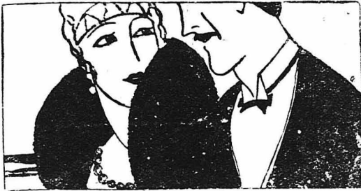
ΗΘΗ ΚΑΙ ΘΕΙΜΑ ΜΑΚΡΥΝΩΝ ΛΩΩΝ