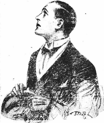
Μὲ τὰ μᾶτια καρφωμένα στὸ παράθυρο...