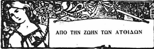
ΑΠΟ ΤΗΝ ΖΩΗΝ ΤΩΝ ΑΤΘΙΔΩΝ