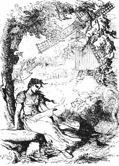
αλλά σωστή παραφροσύνη.