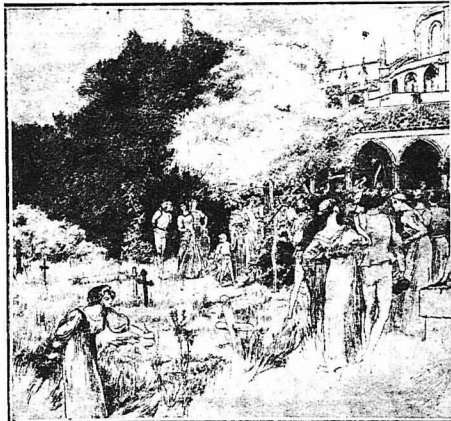
Το «Μπαλέττο των Νεκρών» κατά τόν Μεσαιώνα

Το ιστορικόν της ύποδοχής αυτής, ή όποια εινε ιστορική, έχμος έξής, όπως το άρηγείται ο Μπροντμόρ: «Η βασιλίσα Έλισάβετ του παρέθους δειπνο πολυτελέστατο. Έπι-