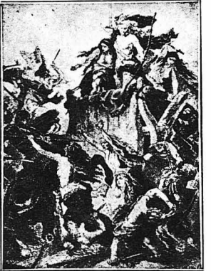
Η ΓΥΝΑΙΚΕΣ ΤΩΝ ΓΑΛΛΩΝ ΣΤΟΙ ΠΟΛΕΜΟ.

'Απειρος είνε ό κόμη ή ήρωϊδες ή όποιες με την άνδρεία και την αυτοθυσία τους κατόρθωσαν να φανούν όχι μόνο χρήσιμες στην πατρίδα τους, άλλα και γά την σφύου πολλές φορές από τούς έχθρούς.