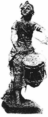
Η ΤΕΡΠΕΖΑΦΙΚΕ Η ηρώς της πολιορκίας της Τουλώνος