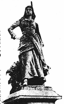
Η ΖΑΚΕΑΙΝΑ ΠΟΜΗΙΕΝ

Η μενοραχία του Ταγκρέδου και της Χλερίνδας. Η τραγική αποκάλυψις. Ο θρύλος και η ιστορία. Η γυναίκες του 17ου αιώνας. Ραδιουργίες και έρωσ. Η βασιλεία της γυναίκας. Η Ίωάννα της Φλάνδρας. Η έκδικη της του αιχμαλώτου συζύγου. Η γυναίκες της Σιέννας και τα παρδαλόχρωμα στρατευμάτα τους. Η Αικατερίνη Σφόρτσα. Μαρία Θηρεσία και Αικατερίνη Β'. Ηρώδες βγαλμένες από το λαό. Ο «άξιος της πατρίδος» υπαξιωματικός. Ο θηλυκός επιλοχίας. Ο δειλός λιποτάκτης και η ανδρεία αδελφή του. Η γυναίκες στην εξστρατεία της Ρωσίας κ.λ.π.