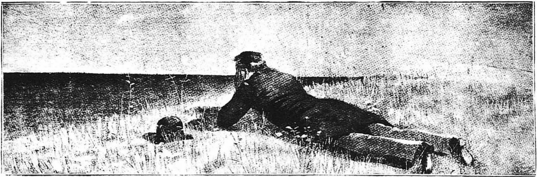
Σ τ ό γ ρ α σ ί δ ι