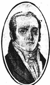
Ο στρατηγός ντε Λα Βαλέτ.

Ο Λα Βαλέτ ώδηγήθηκε από το σύντροφό του στο Υπουργείον τών Έξωτερικών, μέσα στο όποιο οι φίλοι του τον έφρασε άφοσύνη ένα άσπλο. Το ύπουργείον αυτό το διημόνη ο ίδιος; ο πρωθυπουργός Ρισελιέ, που ήταν και ύπουργός τών Έξωτερικών. Ο στρατηγός έμεινε κομμιένος τρεις έβδομάδες στη σοφίτα του ύπουργείου από τον άνώτερον υπάλληλο κ. Μπουσσόν. Έκει δε σιδήρησε να πάη να τον άναζητήση κανείς. Το περίεργον δε