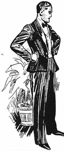
EKEINOS.—Είμαι ένας έξυπνος άντρας !...

EKEINOS.— 'Ακουσε άγάπη μου ! Θέλω να σού δώσω μιά συμβουλή... Ποτέ μη παύεις ; εκ δευτέρου είνε και τό αυτό κόλπο... Την πρώτη φορά τσίριξε θανάσιμα ; Τό πάλεμα, τά φιλιό, βγή- καν φυσικά. Λίγο έλειψε να πιστέψω πώς είνε άλήθεια. Τόσο φυ-