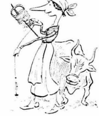
Νοικοκυρὰ ἤθεισα Λε-μονιά.

Δειλινὸ ψυχασαββάτου, πού περμιόνον ἢ ψυχῆς κατὰ ἀπὸ τοὺς ζωντανούς τὸν. Ἐνα κεράκι, μὰ παρὰ-ζήσαι, ἔνα δίσκο μὲ σιτάρι, μὰ συγγωρε-σι ἢ καὶ μὰ θύμισι ἀπλή. Δὲν ζητόνε καὶ πολλὰ ὅσοι φεύγουν γιὰ τὸν ἄλλο κόσμο!... Ἴσως νὰ τὰ ἔχουνε ὅλα ἐκεῖ κάτω καὶ νὰ τοὺς λείπει μόνον ἢ ἀνάμνη-σι τῶν ζωντανῶν... Ποιὸς ἔξερει!