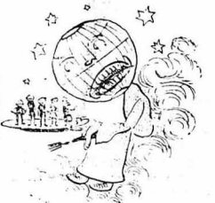
Ἐπειτα ἢ κυρὰ - Μπαρμπούνενα, εἶπεν ἔ-να ἄλλο πεῖο παθητικὸ καὶ κάθε ἔνας; εἶπε τὸ δικὸ του. Μὰ σιγά - σιγά, τὰ μοιρολόγια πήραν τὸ σεβρτά τοῦ τραγουδιοῦ. Τραγουδι-σε τώρα κ' ἢ Λεμονιά: