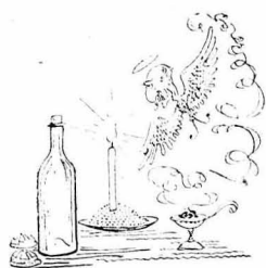
Ἐκεῖ τρεῖς ἡμέρες τριγυρί-ζει ἢ ψυχὴ...