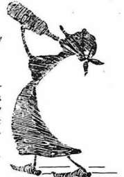
Ἡ κακὴ γλῶσσες ἔ-λεγει πὼς τῶπινε ἢ χρεῖα!